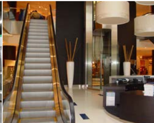
MP STEP Merkamueble. Barakaldo - Vizcaya. Spanien