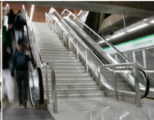
MP STEP Metro von Sevilla. Sevilla. Spanien