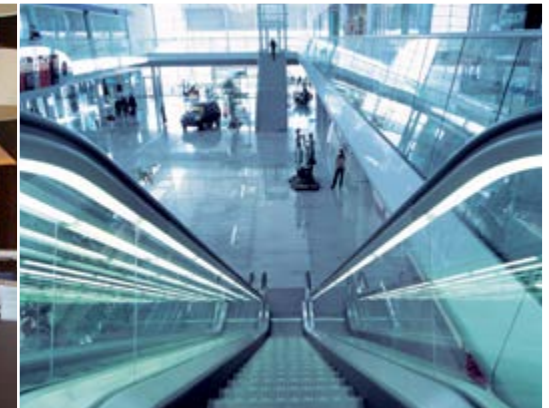
MP STEP Flughafen von Poznan. Poznan. Polen